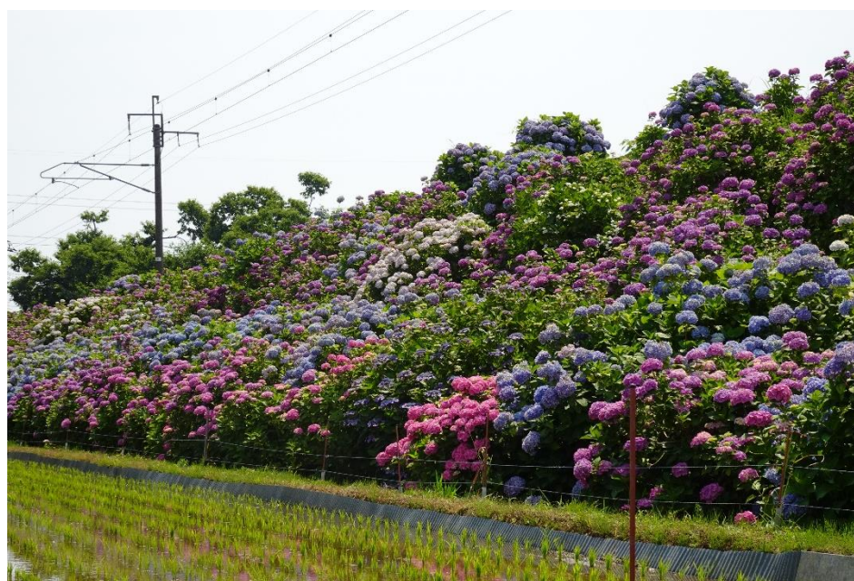
JR佐世保線沿線のあじさい(武雄市上西山区)